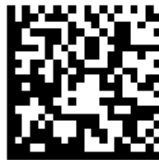
FFMC13 site web